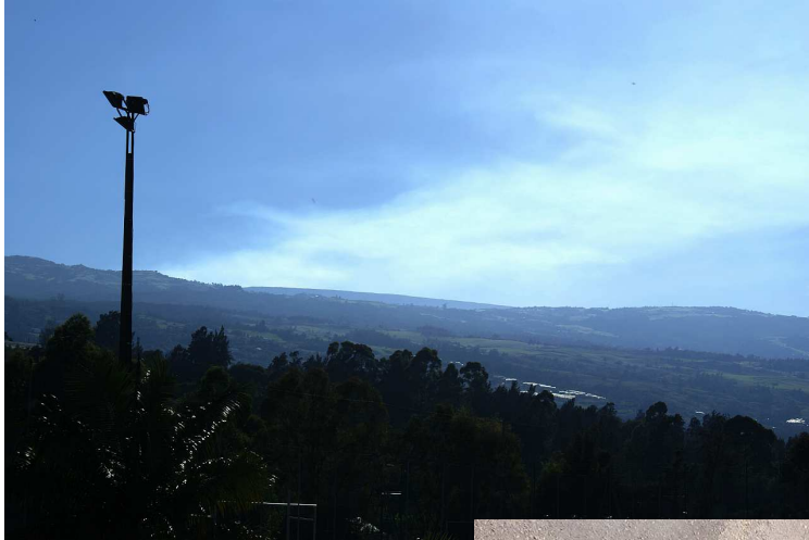
Panache éruptif visible de la RN3 entre le Tampon et la Plaine des Cafres