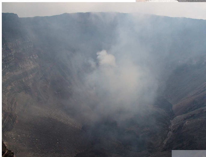
Le panache rempli de temps à autre le Dolomieu