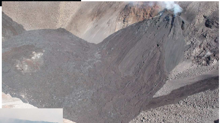
L'éruption en cours dans le Dolomieu, aucune coulée n'est visible à la surface